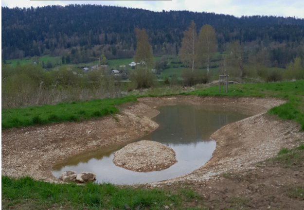
Val-de-Travers : une zone d'eau calme à Môtiers

La Chaux-de-Fonds : aux Eplatures-jaunes, le projet d'étang et de zone humide de plus de 300 m 2 et chez des privés en milieu agricole a passé les étapes administratives et sera réalisé en automne 2026