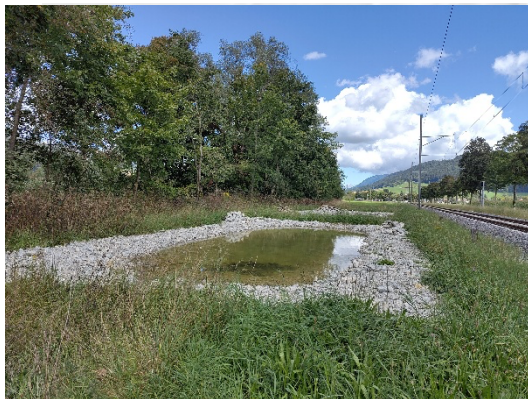
Val-de-Travers : 4 étangs à l'Ileta à Fleurier

Vous avez été nombreux et nombreuses à soutenir la promotion des milieux humides en 2025. Vos dons ont d'ores et déjà permis la réalisation de 7 étangs en 2025 et le travail se poursuit en 2026.